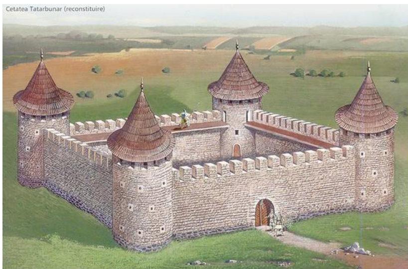
Рис. 4. Реконструкція Татарбунарського замку [Șlapac 2008, p. 45].

внимание на следующий момент: «Достоверно неведомо кем и когда она была возведена здесь небольшая крепость, но позже её разрушили татары. Вновь её отстроил очаковский правитель Кенан – Паша в 1636 г.»